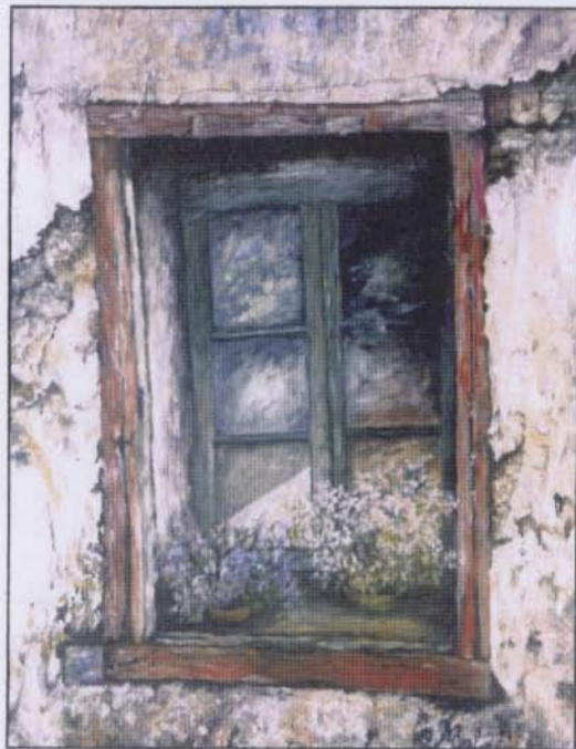
A través de ella alimenté mis sueños - 60x70 - olio su tela