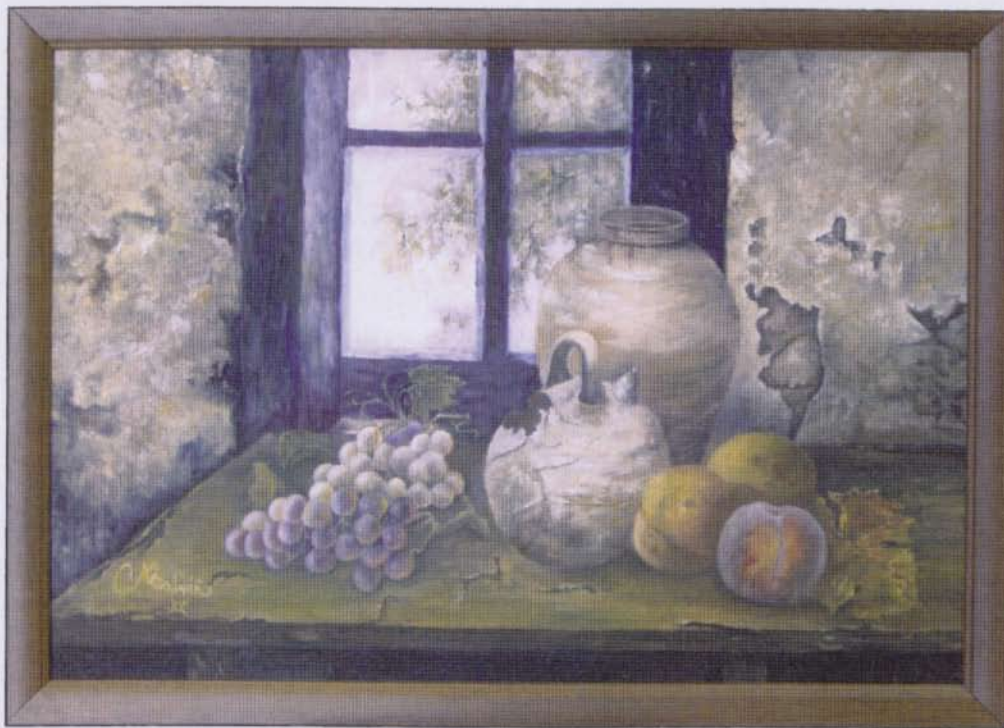
Interior luminoso -50x70- olio su tela