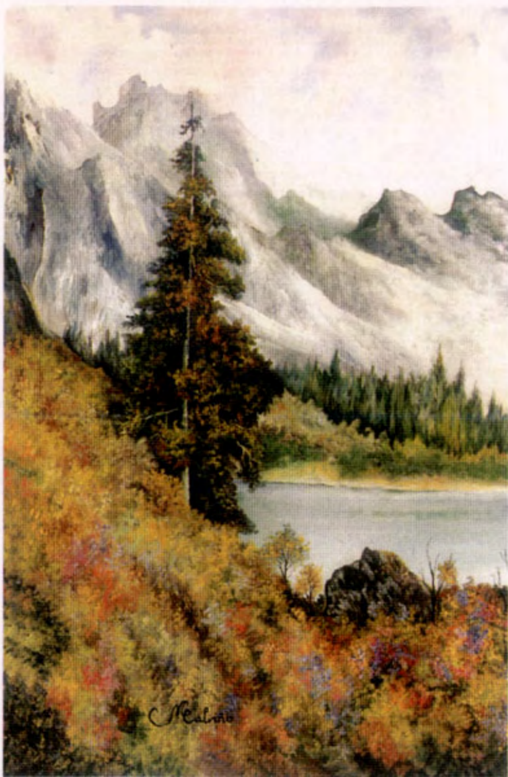
Lago de montaña. 60 x 90. Óleo/tela. 2000-2001.